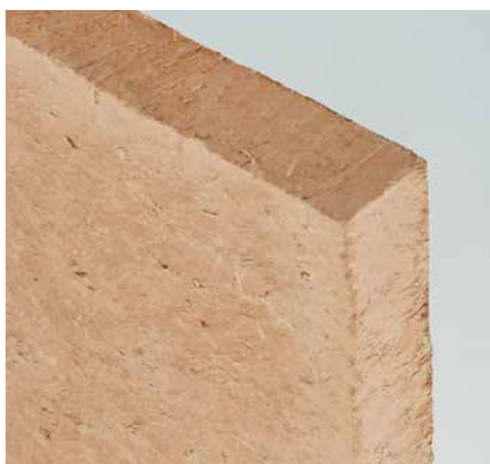
Vue le mur