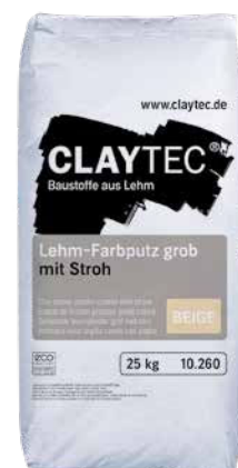
Je Farbton unterschiedliche Gebindelayouts

Einlagiger farbiger Oberputz im Innenbereich. Das Material wird in der Regel 6-10 mm dick aufgetragen. Es ist damit auch für Untergründe geeignet, die für den Auftrag eines Lehm-Dünnschichtenfinishes zu uneben wären. Der dicke Auftrag erlaubt auch die Ausbildung grob-strukturierter Oberflächen. Lehm-Farbputz grob wird weder weiter beschichtet noch gestrichen. Dies spart nicht nur Kosten: Die Lehmoberfläche ist im Raum pur und eins-zu-eins erlebbar.