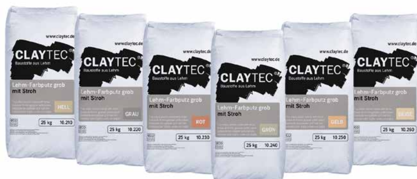
Je Farbton unterschiedliche Gebindelayouts