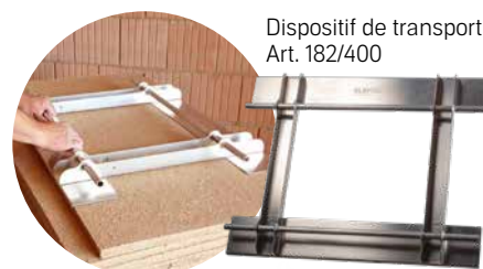
Dispositif de transport Art. 182/400

Panneau d'argile pour l'habillage des ossatures en bois ou métal des cloisons intérieures, parements, surfaces de plafonds et de sous-pentes. Le panneau d'argile lourd offre un apport d'argile important pour l'habitat, y compris tous les effets positifs sur le climat ambiant, notamment sur le plan thermique. Pour la découpe, il convient d'utiliser une scie circulaire. Le panneau d'argile D 22 offre une trame large de 625 mm pour l'ossature porteuse des panneaux. Outre cette fiche de produit, le manuel ClayTec sur les cloisons intérieures écologiques dans le système s'applique.