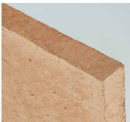
Vue le mur